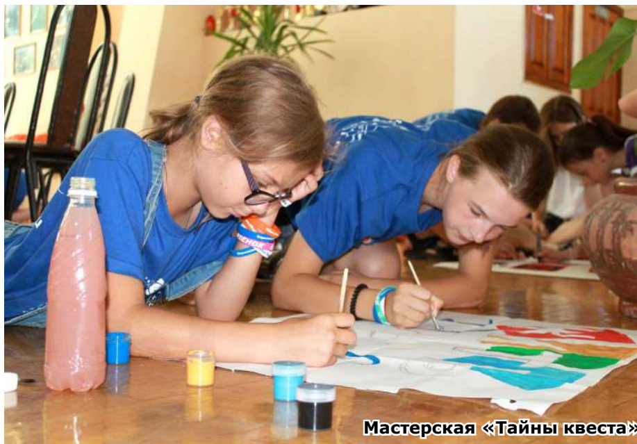
Мастерская «Тайны квеста»

- С детства любил играть во дворе с ребятами в разные игры. Собирал всех, что-то придумывал, устраивал. Это был мой первый опыт в роли организатора. Работая в детском загородном лагере «Берёзка» в Димитровграде в должности специалиста по культурно-массовым мероприятиям, стал сам придумывать и организовывать для детей квест-игры. Опыт работы показывает, что детям это интересно. Они сами придумывают свой маршрут, осуществляют поиск, думают над траекторией, то есть их результат