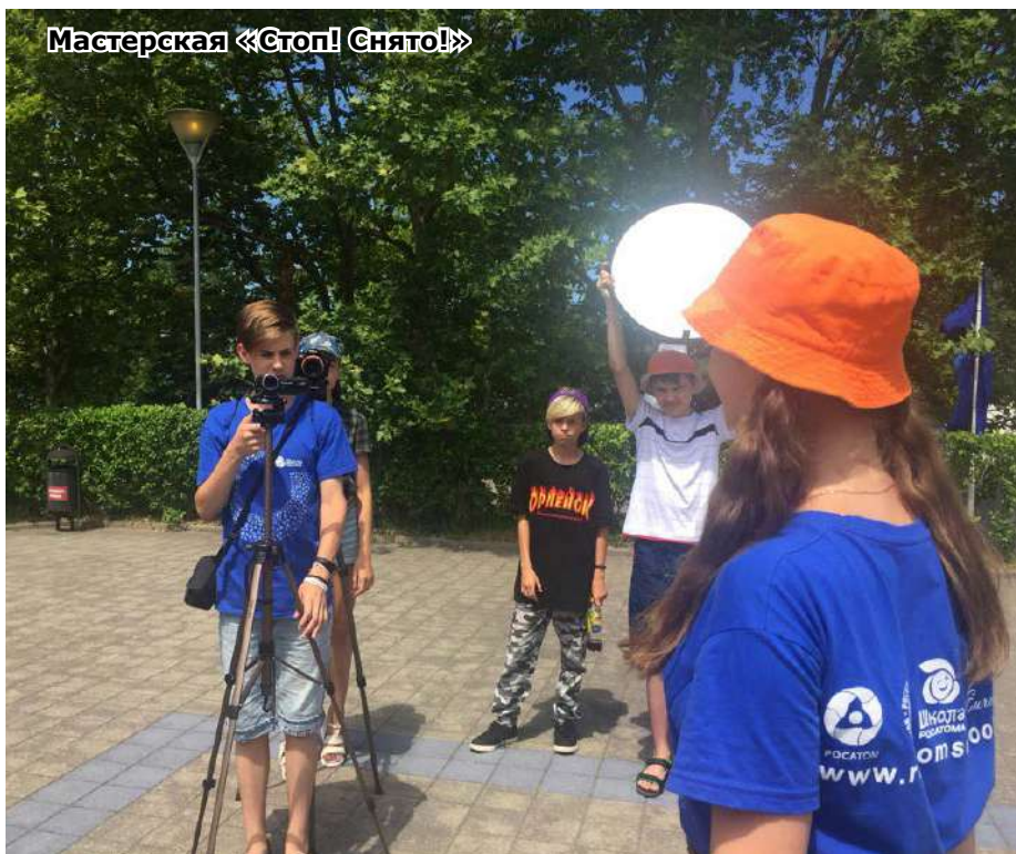
Мастерская «Стоп! Снято!»

- Одно из главных моих достижений - дети, которых мне удалось «втянуть» в этот проект. Когда мы с ними начинаем работать, они осознают свои возможности и раскрывают свои способности. Для меня это важно. Ну