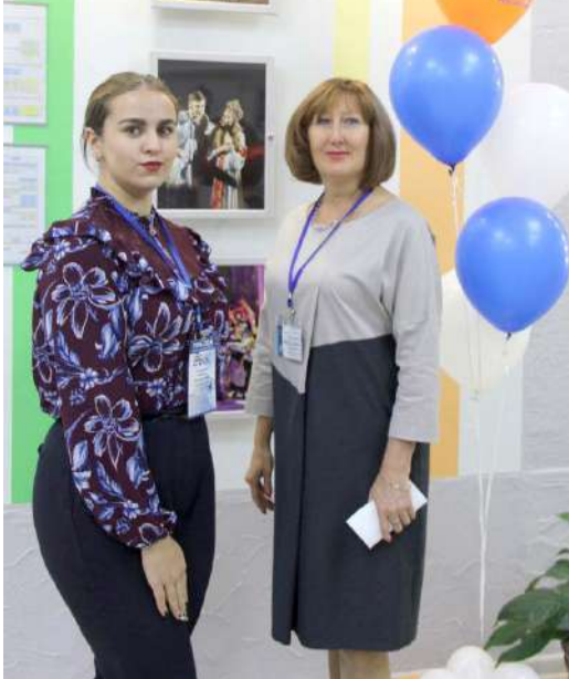
Корреспонденты «Rosatom's COOL» на финале проекта «Школа Росатома»