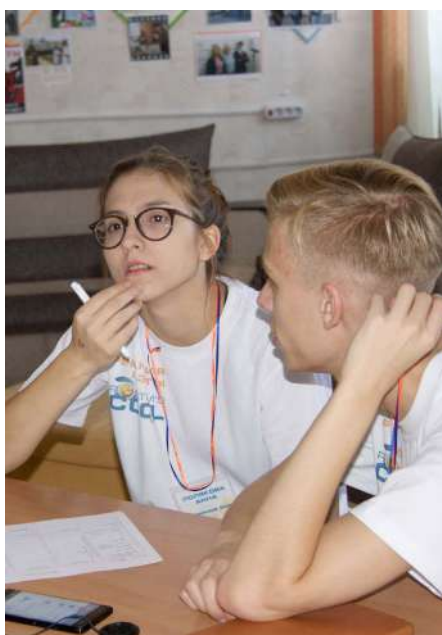
всех столах лежало два листа бумаги. На первом – таблица для выпол-

нения заданий пяти туров КВИЗ-игры: «Литературная разминка», «Эрудиция», «Логика», «ЧепухАтом» и «На все четыре стороны».