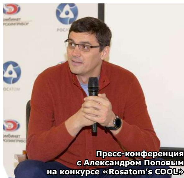
Пресс-конференция с Александром Поповым на конкурсе «Rosatom's COOL»