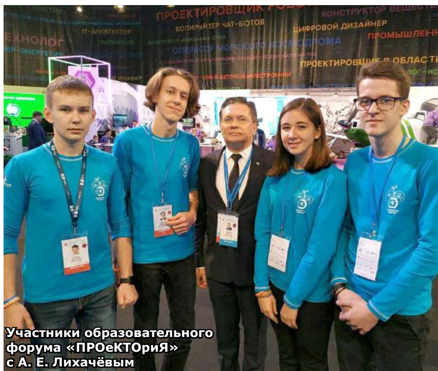
Участники образовательного форума «ПРОЕКТОрия» с А. Е. Лихачёвым