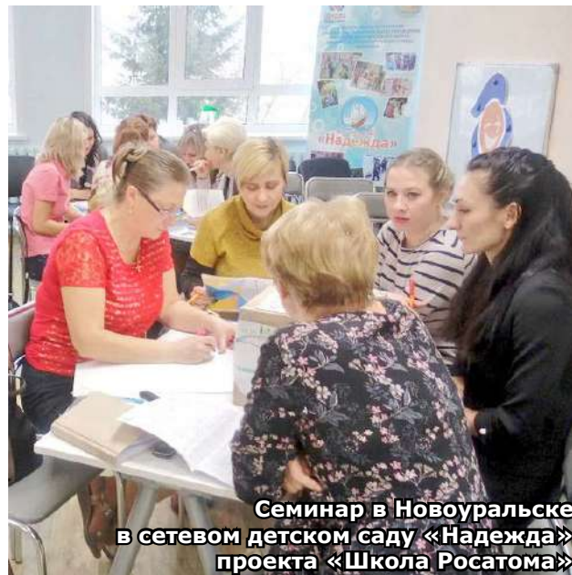
Семинар в Новоуральске в сетевом детском саду «Надежда» проекта «Школа Росатома»