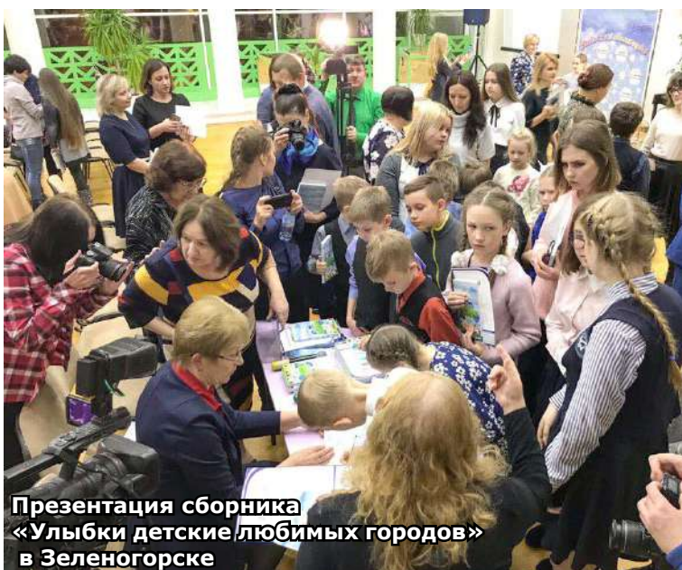
Презентация сборника «Улыбки детские любимых городов» в Зеленогорске