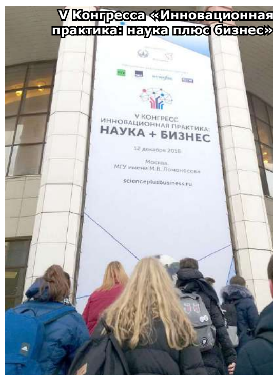
У Конгресса «Иновационная практика: наука плюс бизнес»