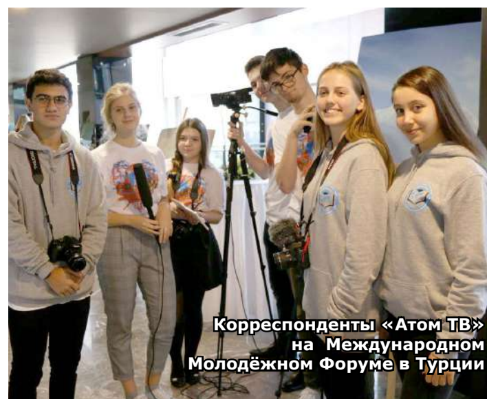
Корреспонденты «Атом ТВ» на Международном Молодёжном Форуме в Турции