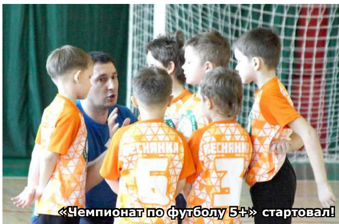
«Чемпионат по футболу 5+» стартовал!