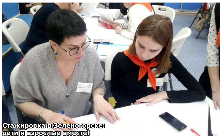
Стажировка в Зеленогорске: дети и взрослые вместе!