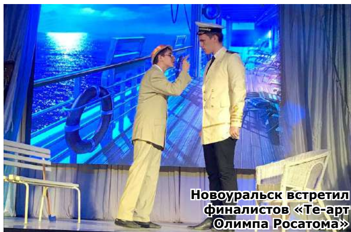
Новоуральск встретил финалистов «Те-арт Олимпиа Росатома»