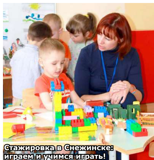
Стажировка в Снежинске: играем и учимся играть!