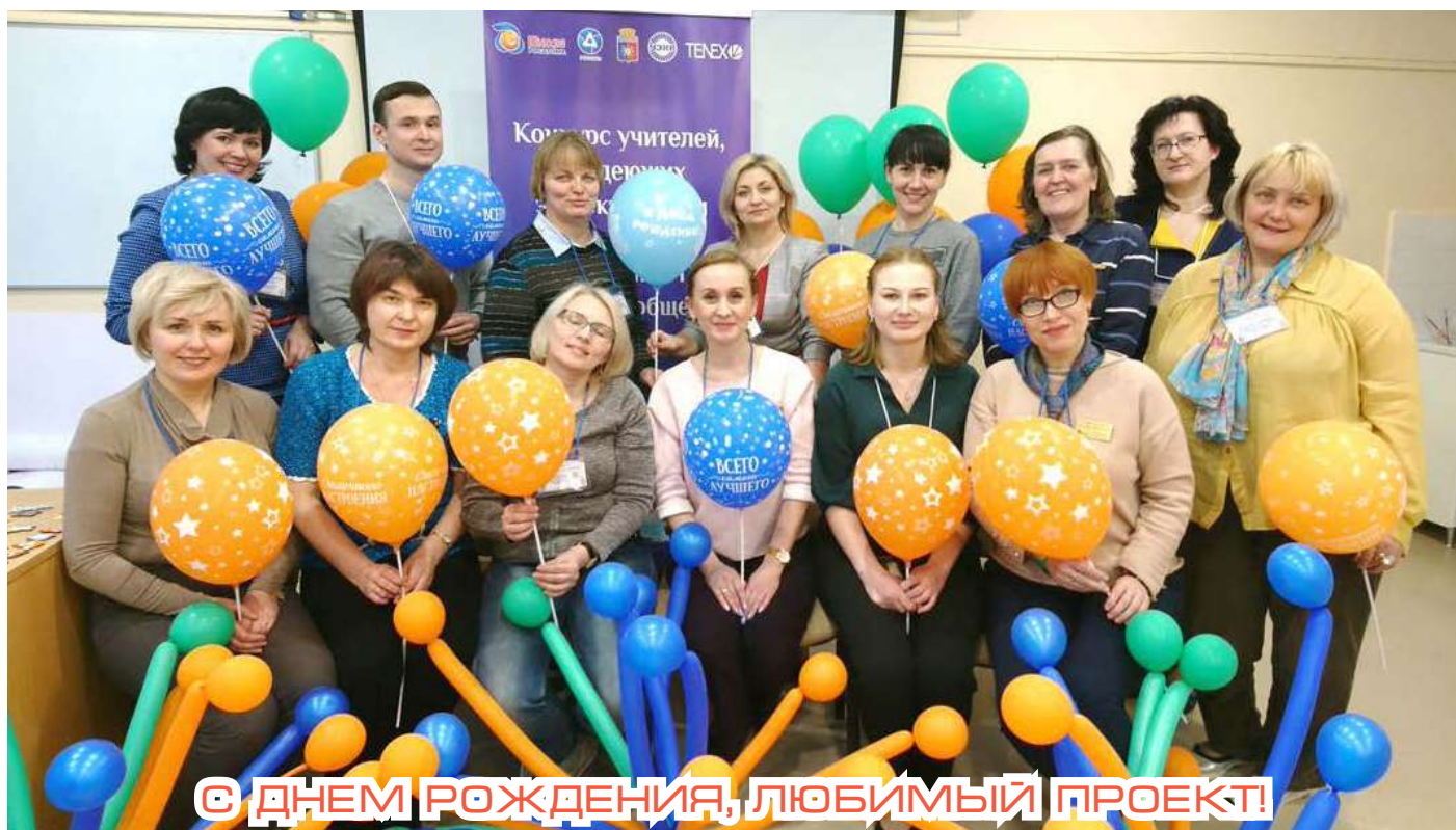
С ДНЕМ РОЖДЕНИЯ, ЛЮБИМЫЙ ПРОЕКТ!