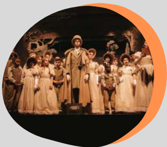
музыкально-поэтическая постановка ИГРАЕМ ПУШКИНА ПО-РУССКИ

участники отраслевой смены проекта «Школа Росатома» в рамках Ливадийского форума, Крым, 2019 год