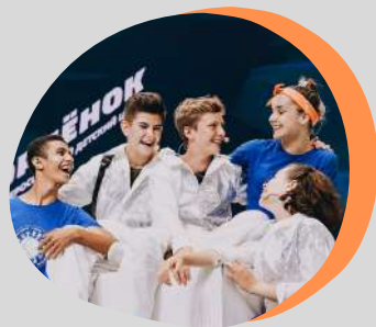
мюзикл СЕВЕРНОЕ СИЯНИЕ

участники отраслевой смены проекта «Школа Росатома» в ВДЦ «Орленок», 2019 год