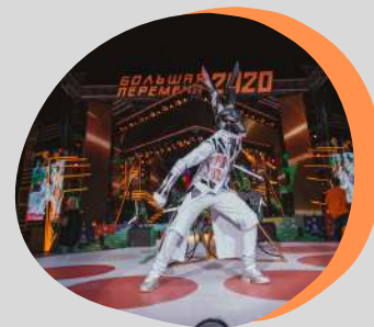
мюзикл БОЛЬШАЯ ПЕРЕМЕНА. БУДУЩЕЕ ЗАВИСИТ ОТ ТЕБЯ

участники из городов: Ангарск, Зеленогорск, Саров, Железногорск, Нововоронеж, Лесной, Димитровград, Крым, МДЦ "Артек", 2020 год