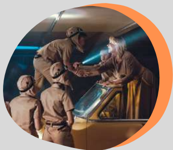
драматический спектакль НЕМАЛЕНЬКИЙ ПРИНЦ

участники - творческие коллективы из городов: Лесной, Саров, Арзамас. Премьера состоялась в г.Москва, парк Зарядье, 2018 год