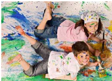
Место для рисования на полу