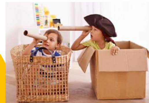
Различные коробки чтобы спрятаться или играть